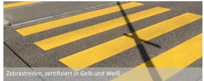
Zebrastreifen, zertifiziert in Gelb und Weiß