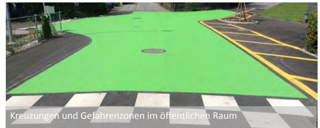
Kreuzungen und Gefahrenzonen im öffentlichen Raum