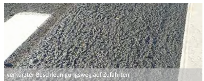
verkürzter Beschleunigungsweg auf Zufahrten