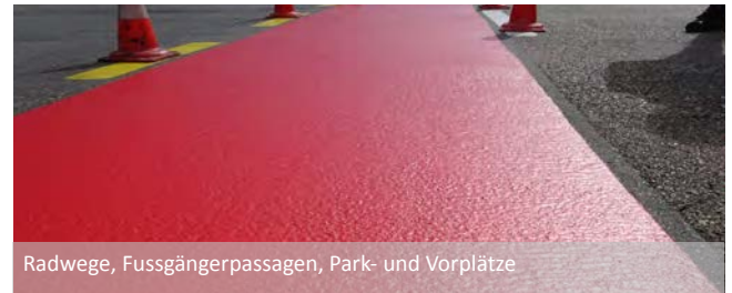
Radwege, Fussgängerpassagen, Park- und Vorplätze