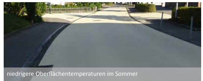
niedrigere Oberflächentemperaturen im Sommer